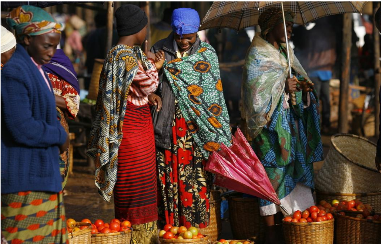
Mercado de Bvumbwe, Malawi, 2009; las mejoras en el regadío hacen de los tomates un buen cultivo para las cooperativas agrícolas.